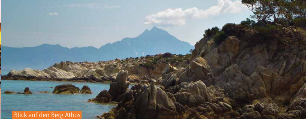
Blick auf den Berg Athos