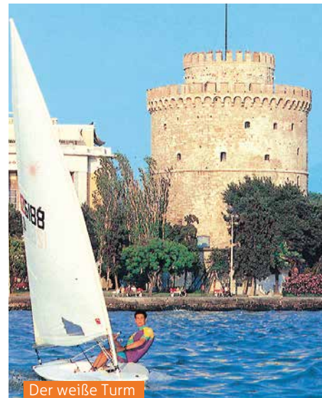
Der weiße Turm

Frühes Frühstück im Hotel. Die Fahrt geht zunächst durch eine langgestreckte, fruchtbare Ebene des Tempi-Tals nach Larissa und weiter nach Kalambaka. Kurz hinter Kalambaka erheben sich die steilen Felskegel, die im Tal des Pinios auf ihren Kuppen die berühmten byzantinischen Klöster beherbergen. Diese Klöster wurden Anfang des 14. Jh. erbaut und waren oft nur mit Strickleitern zu erreichen. 2 dieser Klöster werden sie bei diesem Ausflug besuchen. In einem byzantinischen Kloster, das mit das älteste in diesem Tal ist, besichtigen Sie z.B. die Kirche und das Museum der Mönche. Die sehr hoch gelegenen Klöster dienten über Jahrhunderte den Einsiedlermönchen als Meditations-, Gebets- und Aufenthaltsort. Dort haben sie außerdem wertvolle Ikonen, Gemälde und kunstvoll verzierte Kodizes erstellt. Diese eindrucksvolle Tour vermittelt Ihnen immer wieder neue Eindrücke für ein Fotomotiv. Rückfahrt zu Ihrem Hotel