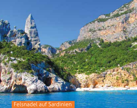
Felsnadel auf Sardinien