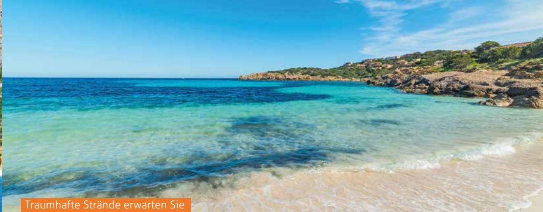
Traumhafte Strände erwarten Sie