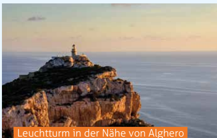
Leuchtturm in der Nähe von Alghero

„Sardinien, das keinem anderen Ort gleicht“, schrieb D. H. Lawrence 1919 über die zweitgrößte der Mittelmeereinseln - und auch ihre Bewohner sind einzigartig. Vor 3000 Jahren schützten die Sarden sich in Nuraghen vor ihren Feinden. 7000 der bronzezeitlichen Kastelle soll es gegeben haben und noch heute prägen sie das Bild der Insel. Da ist aber auch die phönizische Siedlung Tharros aus dem 8. Jahrhundert v. Chr., die von den Römern später überbaut wurde - und mehr als 100 romanische Kirchen, gotische Kapellen und die Kathedrale Santa Maria. Auch wenn die Insel zur Siesta typisch italienisch lahm liegt, die Jugend auf Rollern durch die Städte fährt und Cappuccino und Chianti auf jeder Getränkekarte stehen, lässt sie sich nicht mit dem Festland vergleichen. Nicht nur 11 Fahrstunden liegen zwischen Genua und der nördlichen Inself Spitze - sondern Welten.