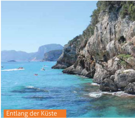
Entlang der Küste