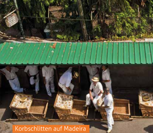
Korbschlitten auf Madeira