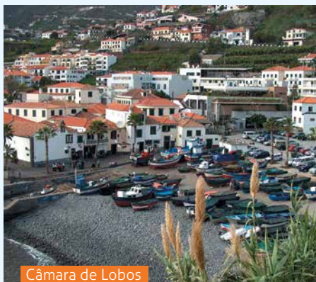
Câmara de Lobos

Seine Besucher gaben Madeira den Namen 'Insel des ewigen Frühlings'. Nicht zu heiß und nicht zu kalt ist es dort und manchmal regnet es erfrischend. Dieser subtropischen Witterung verdankt die Insel ihre üppige Vegetation. Über 760 Pflanzenarten wachsen dort und blühen das ganze Jahr hindurch. Diese liebevolle Atmosphäre hat Madeira schon im 19. Jh. zu einem beliebten Winterdomizil gemacht - vor allem für Englands High-Society. Doch die Zeiten der Aristokratie sind auf Madeira vorbei, das Publikum ist jünger und abenteuerlustiger geworden. Wanderer finden ihr Glück auf drei Achtzehnhundertern, Kletterer an der atemberaubenden Steilküste - und unruhige Gemüter können sich die Zeit in der geschäftigen Inselmetropole Funchal vertreiben. Hätte ein Sturm portugiesische Schiffe 1418 nicht von ihrer Route abgetrieben, wäre das Archipel womöglich lange unentdeckt geblieben. Genießen Sie abwechslungsreiche Tage auf dieser traumhaften Insel mitten im Atlantik!