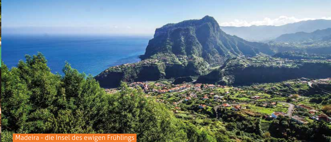
Madeira - die Insel des ewigen Frühlings