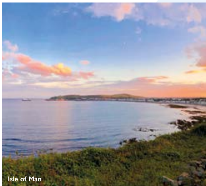
Isle of Man

In Cobh bestaunen Sie die St.-Colman-Kathedrale, die sich kontrastreich über die bunten Häusern der Stadt erhebt. Am Land's End blicken Sie über den weiten Atlantik, in der Kathedrale von Winchester zum hohen Deckengewölbe hinauf bevor die Reise zurück nach Hamburg geht.