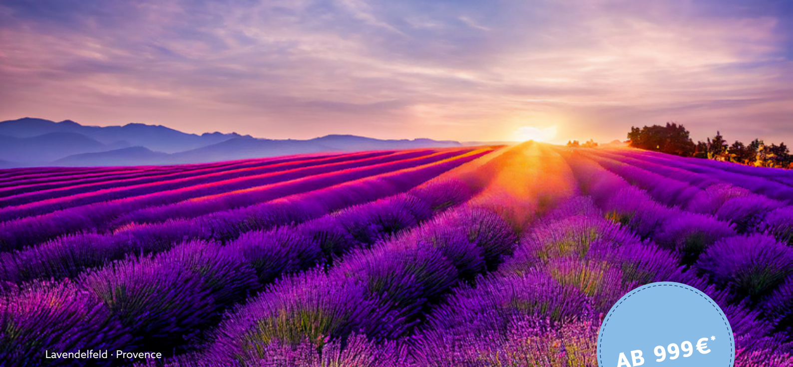
Lavendelfeld · Provence