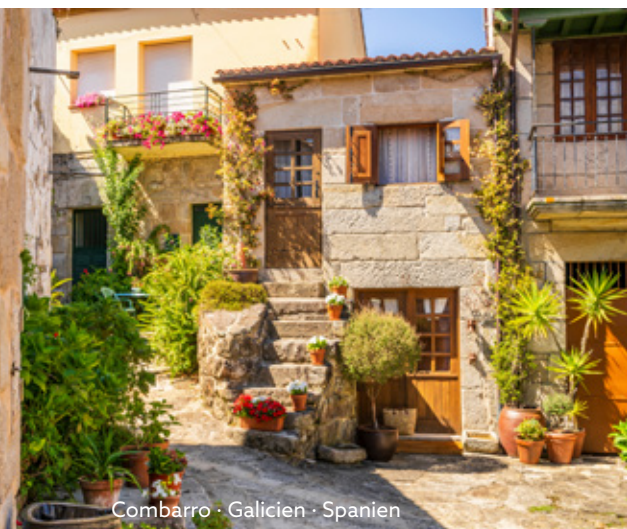
Combarro · Galicien · Spanien