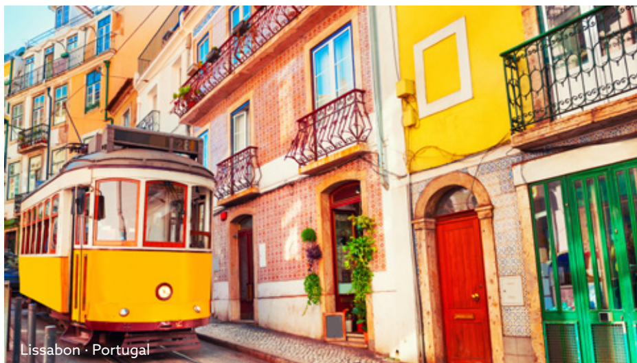
Lissabon · Portugal