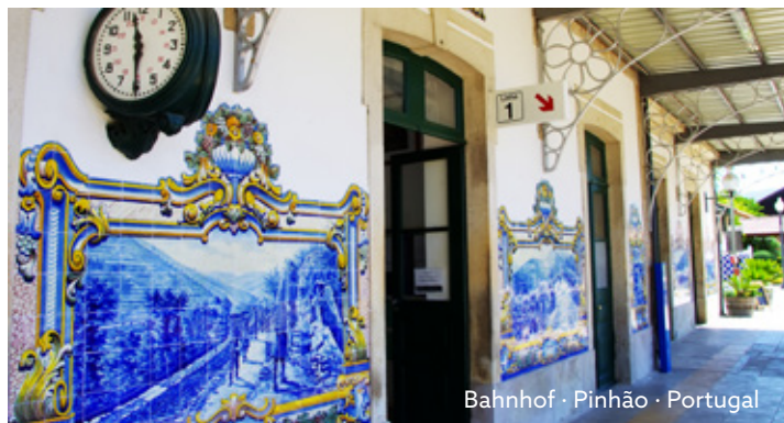
Bahnhof · Pinhão · Portugal

Besuch des berühmten von blau-weißen Keramikfliesen geschmückten Bahnhofs in Pinhão