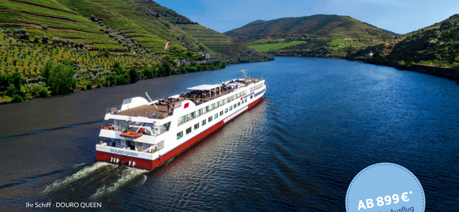
Ihr Schiff · DOURO QUEEN