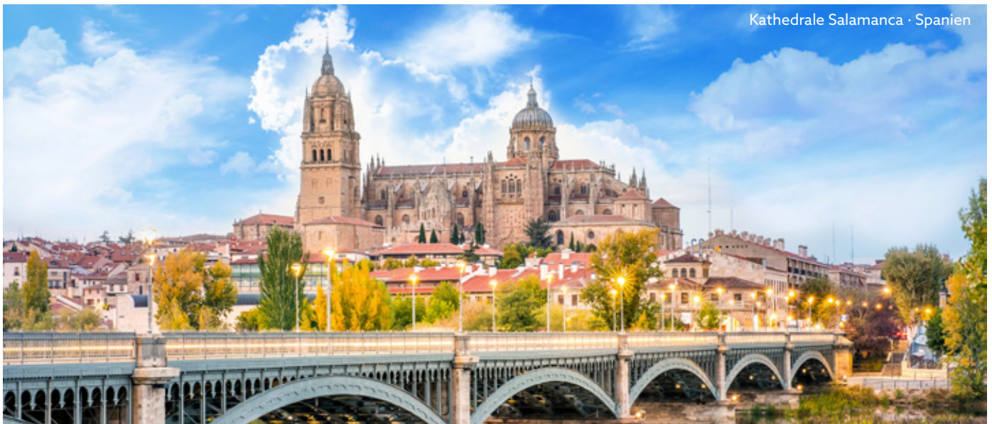
Kathedrale Salamanca · Spanien