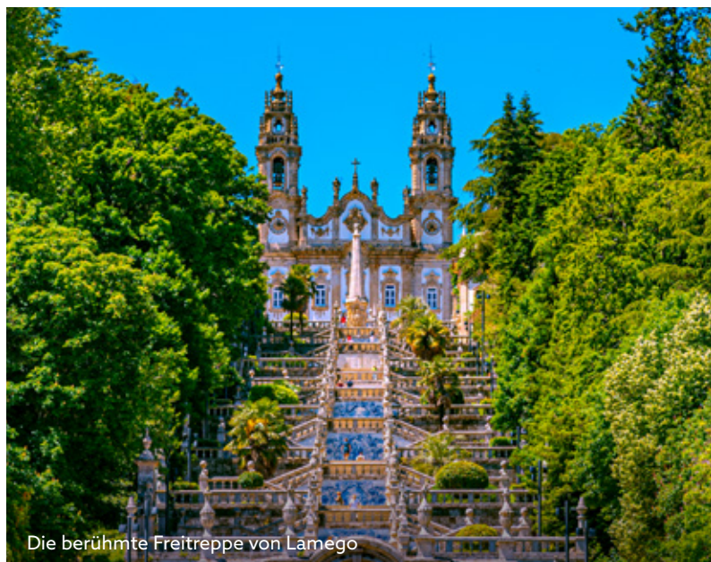
Die berühmte Freitreppe von Lamego