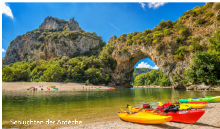
Schluchten der Ardèche

Eindrucksvolle Naturlandschaften erleben bei einem Ausflug zur Ardèche-Schlucht