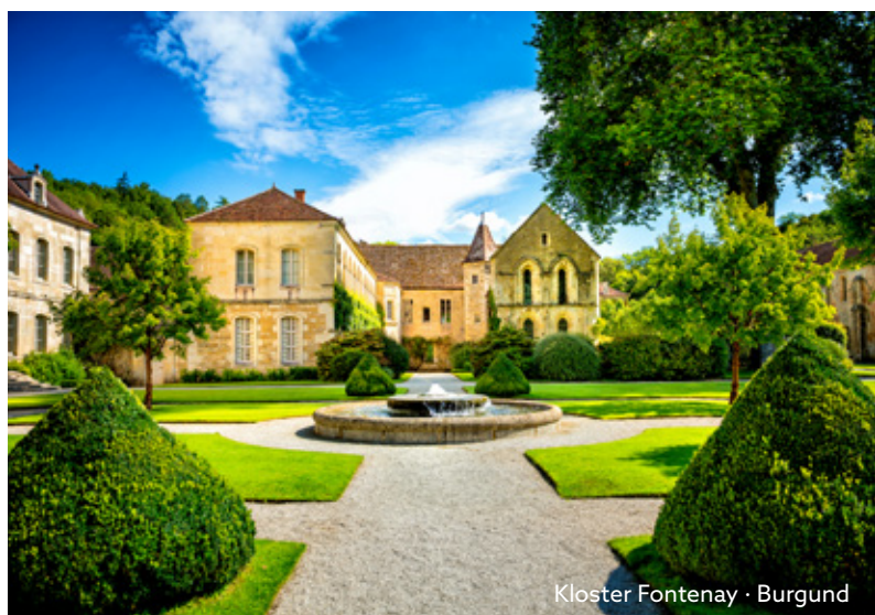
Kloster Fontenay · Burgund

* Mit 100€ Ultra-Frühbucher-Ermäßigung bei Buchung bis 30.09.2023.