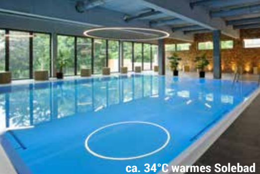
ca. 34°C warmes Solebad