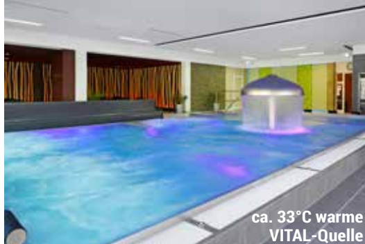
ca. 33°C warme VITAL-Quelle