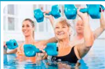
mit AQUA KINETIK, RÜCKENGYMNASTIK u. v. m.

Durch den Einsatz verschiedener Hilfsmittel (z. B. Hanteln) werden unterschiedliche Muskeln schonend trainiert.