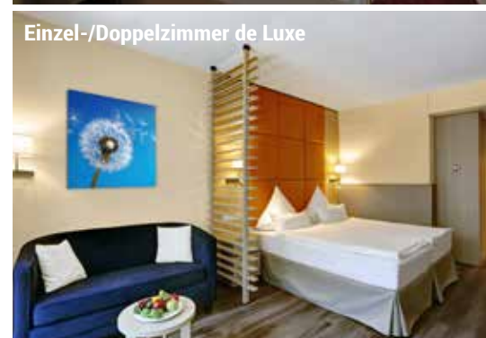
Einzel-/Doppelzimmer de Luxe