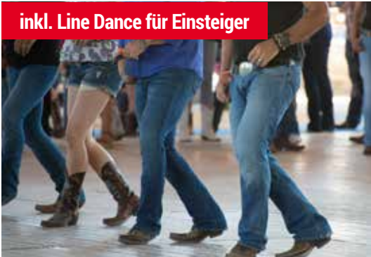
inkl. Line Dance für Einsteiger