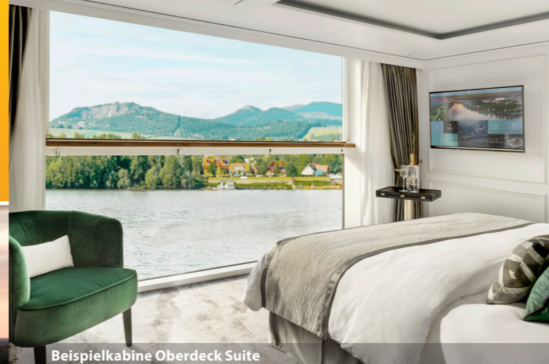
Beispielkabine Oberdeck Suite