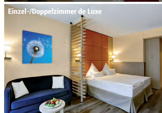
Einzel-/Doppelzimmer de Luxe