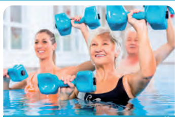
mit AQUA KINETIK, RÜCKENGYMNASTIK u. v. m.

Durch den Einsatz verschiedener Hilfsmittel (z. B. Hanteln) werden unterschiedliche Muskeln schonend trainiert.