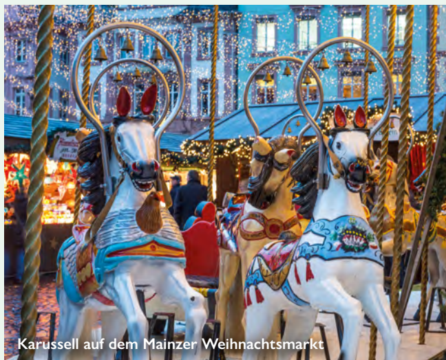
Karussell auf dem Mainzer Weihnachtsmarkt

Entspannt an die Reling gelehnt, fahren Sie den Romantischen Rhein entlang. Können Sie die Loreley schon entdecken? Auch die festlich geschmückten Altstadtplätze von Koblenz lassen Sie den Alltagsstress schnell vergessen bevor Sie wieder Köln erreichen.