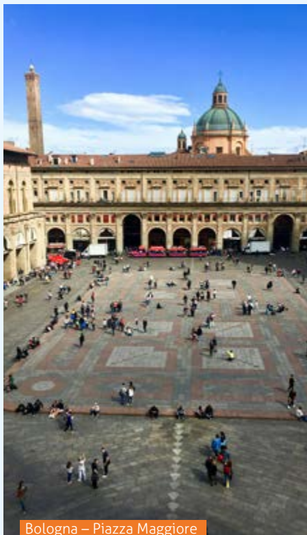
Bologna – Piazza Maggiore

Reisen Sie in Gedanken zurück in die Anfangszeiten des Tourismus und erleben Sie mit uns das heutige Rimini und die Emilia-Romagna! Tolle Strände, wundervolle Ausflugsziele und landestypische Spezialitäten erwarten Sie. Erleben Sie einzigartige Metropolen wie Bologna, mittelalterliche pittoreske Kleinstädte, wie Gradara, Mondaino und Urbino, traumhafte Landschaften und den sehr sehenswerten Zwergstaat San Marino, dessen Altstadt hoch oben auf einem Bergrücken thront. Diese Reise werden Sie immer in guter Erinnerung behalten!