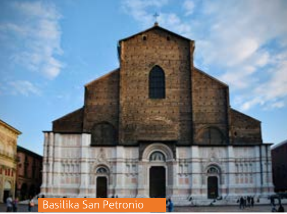
Basilika San Petronio

UNESCO-Weltkulturerbestätte, die einst das Zentrum der italienischen Renaissance war. Tauchen Sie ein in die traditionellen Köstlichkeiten dieser Region und erleben Sie einen unvergesslichen Ausflug! Abendessen und Übernachtung im Hotel.