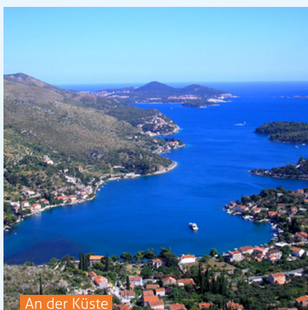
An der Küste

Die Adriatische Küste Kroatiens ist mindestens so schön wie die italienische Adria oder die Riviera. Viele Kenner sagen, sie sei, vor allem wegen der vorgelagerten Inseln, noch weit aus schöner. Die Uferstraße, die „Adria Magistrale“, ist das mit Abstand Großartigste, was die Straßenbauer an irgendeiner Küste jemals angelegt haben. Klug und kühn ausgedacht, führt sie an alten Hafendörfern, an zerklüfteten Buchten und endlosen Badestränden vorbei. Selten verliert man das Meer aus dem Auge - und wenn, dann nur, weil die Straße ein besonders klotziges Bergmassiv umrunden muss, um dann gleich wieder einen zauberhaften Blick auf die nächste Bucht freizugeben. Wer diese Magistrale einmal in ihrer ganzen Länge gefahren ist, die unendlich vielen Buchten gesehen hat und im Geist auch noch die vielen hundert Inseln hinzuzählt (alles in allem beträgt die Küstenlinie über 6000 Kilometer), der kann sich ausrechnen, dass hier alle Feriengäste der Welt Platz hätten.