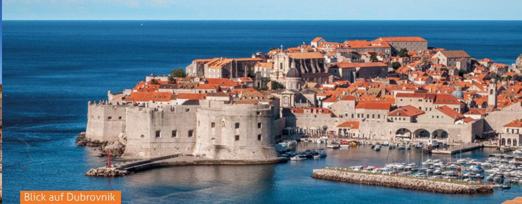
Blick auf Dubrovnik